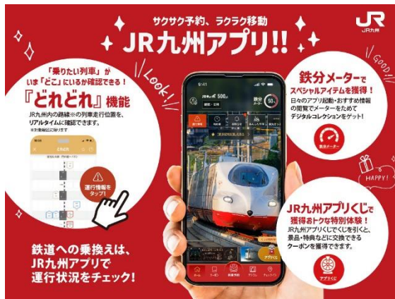
バス車内の運賃表示モニター表示イメージ